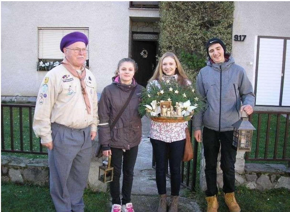
Foto – bošianski skauti v akcii

Po adventnom období nastal čas vianočný. Už tradične bošianski skauti roznášali betlehemske svetlo po celom bošianskom dekanáte tzn. že aj do našich filiálnych obcí Krnča a Práznovce.