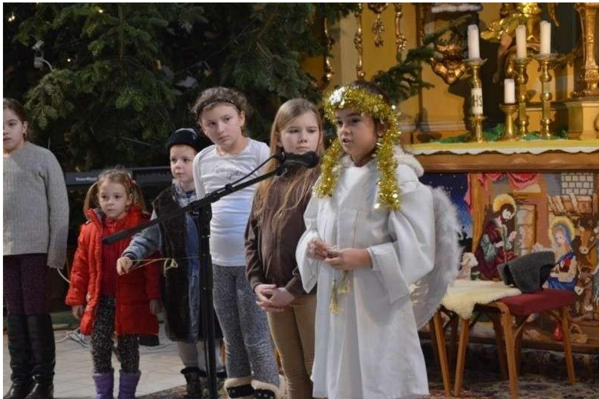
Foto – deti počas jasličkovej pobožnosti

28.decembra sa predstavili vo svojej pripravenej jasličkovej pobožnosti . Predstavili sa v nej deti z bošianskeho eRka , aby nám tak spríjemnili vianočné dni a ukázali radosť z narodenia Ježiša na tento svet.